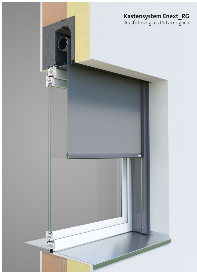
Kastensystem Enext_RG Ausführung als Putz möglich