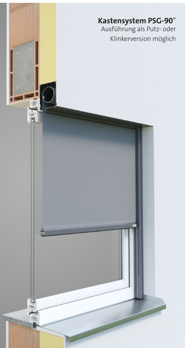
Kastensystem PSG-90° Ausführung als Putz- oder Klinkerversion möglich