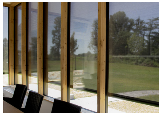
Sicht von innen