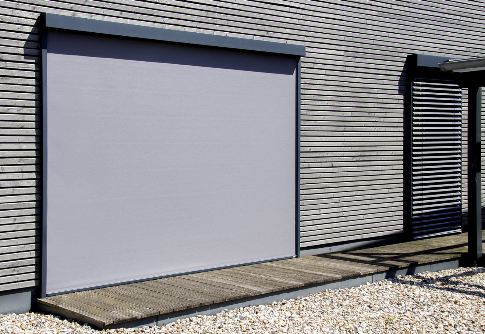
Kastensystem SG-90° Ausführung als Laibungsmontage