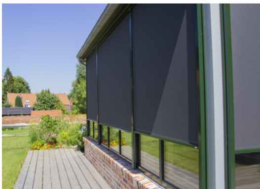
Sicht von außen